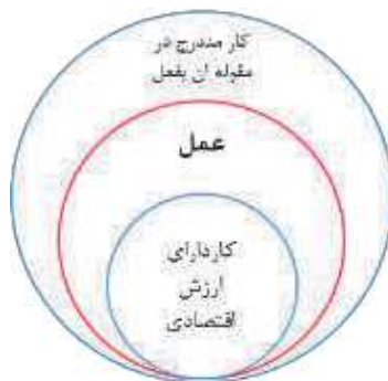
شکل ۲: نسبت اصطلاح عمل با ادبیات جعفری

نتیجه آنکه کار در ادبیات جعفری، تساوی کامل با مفهوم عمل نداشته و معنایی اعم از عمل دارد و آنچه می‌توان دقیقاً معادل عمل دانست، کار غایی است. توجه به این نکته مانع از خلط‌های بزرگی میان ادبیات جعفری و ادبیات معاصر می‌شود.